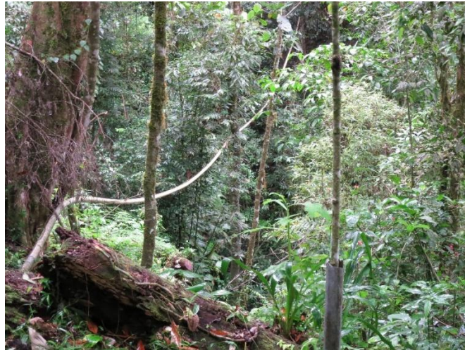
Vandforsyningen løber i rør gennem tæt regnskov

Socialt arbejde i det nordlige Nicaragua, støttet fra Danmark