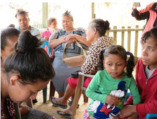
Gruppearbejde i Las Victorias