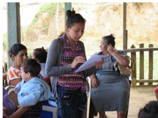
Fremlæggelse af gruppearbejde i Las Victorias