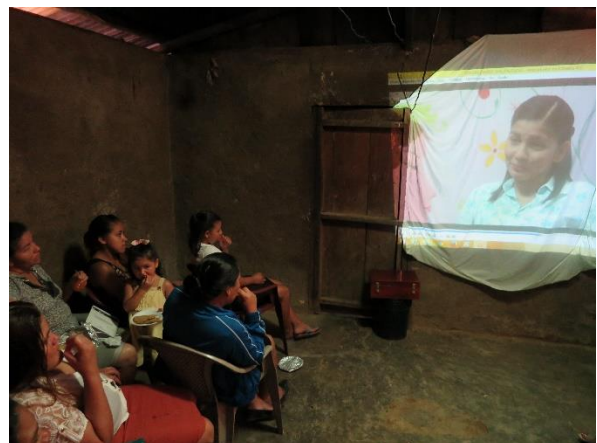
Videosekvens som oplæg til gruppedebat i Arenales