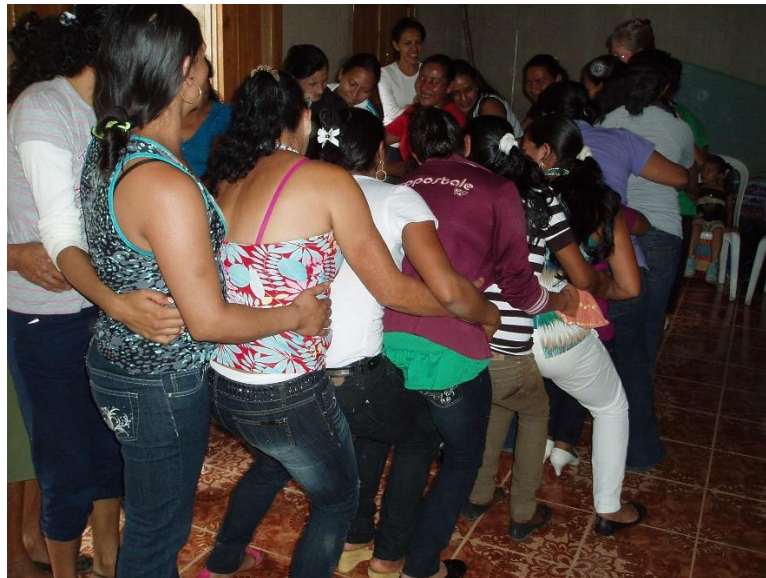
2 Kvinder i selvhjælpsgruppe arbejder med selvudvikling og selvbevidsthed

Socialt arbejde i det nordlige Nicaragua, støttet fra Danmark